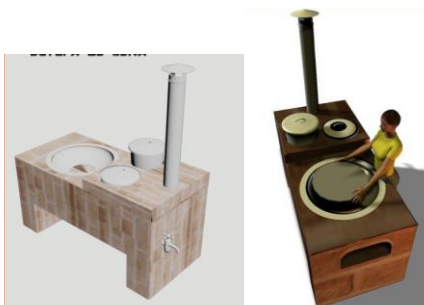
Figura. 1 Estufa Chinantla.

La propuesta de diseño giró en torno a toda la problemática anteriormente señalada, por lo que se buscó reducir los riesgos y daños a los residentes de San Juan Petlapa al cocinar con un diseño de cocina. En el campus universitario, se procedió a generar diversas soluciones a través de bocetos mejorados por software Rinoceronte y 3D Studio.