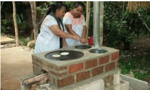
Figura. 2 Estufa Chinantla en la comunidad de San Juan Petlapa.

La estufa como objeto de diseño pertinente, fue construido con materiales propios de la comunidad como fueron la arcilla y el cemento, así como otros materiales disponibles en la zona. La cocina se construyó completamente cerrada, característica que reduce el consumo de combustible, reduce la irritación ocular, ahorra tiempo y dinero, y reduce las enfermedades respiratorias. En su estructura se incluyen: un anillo con metal curvo, lo permitiendo adaptarse a cualquier tamaño de plancha, un recipiente de líquido capaz de calentarse a través de la radiación generada por la llama que llega a la plancha, y una llave para la salida del líquido, así como una chimenea que lanza los gases fuera de la casa.